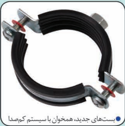
● بست های جدید، همخوان با سیستم کم صدا